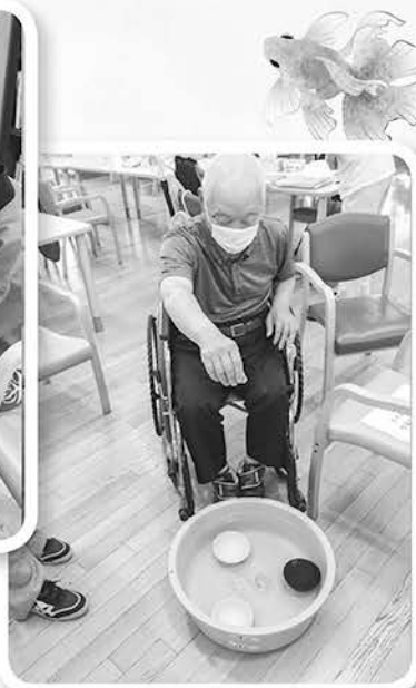
小さいお椀に 上手に入るかな? (^^)