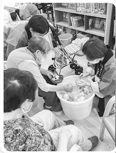
たくさん取れました♪