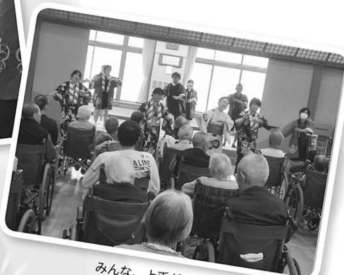
みんな、上手だごど😊