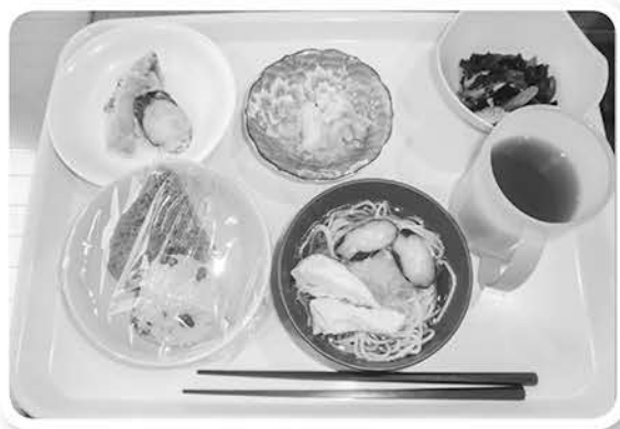
ちょっと、ご馳走もできたヨ～