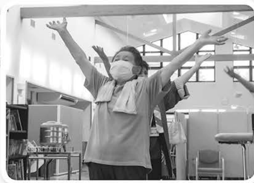
利用者様と一緒に葛巻音頭(^^♪ 踊って頂きありがとうございます!