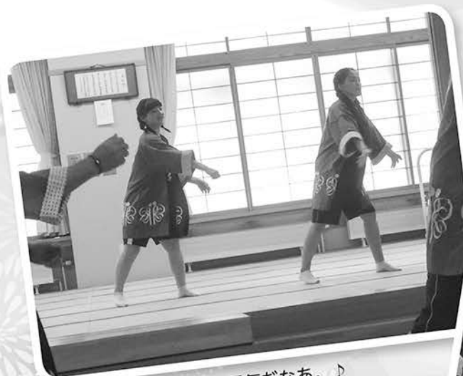
♪わがいものは、元気だなあ。♪