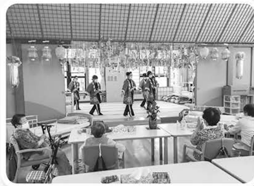
職員による「チャグチャグ馬っこ」 を披露させて頂きました!!