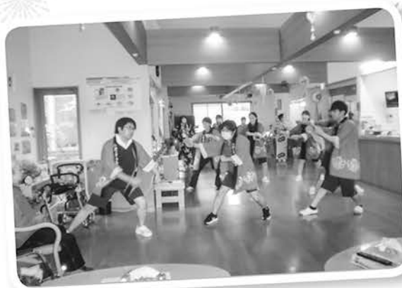
若い人の力強い踊り、ヨサコイソーラン舞