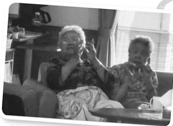
イヤ～上手だなあ～若い頃を思い出すねえ～