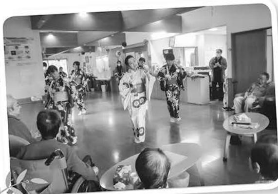
先輩によるチャグチャグ馬っこ。