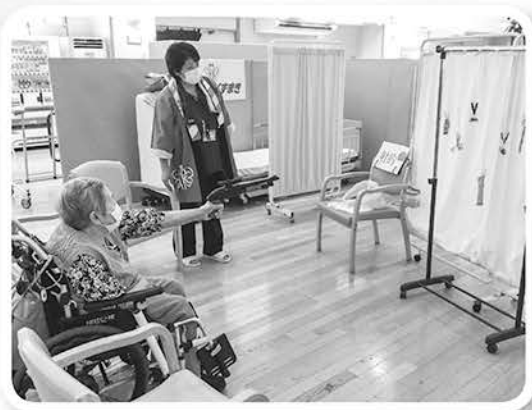
しっかり狙ってお菓子をゲット!!