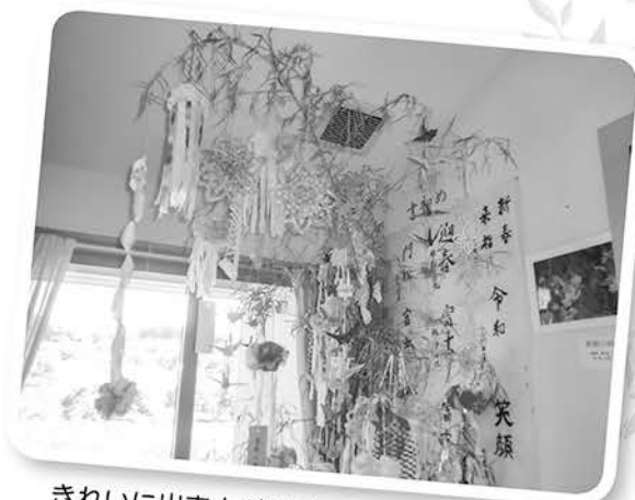
きれいに出来上がりました。バンザイ！