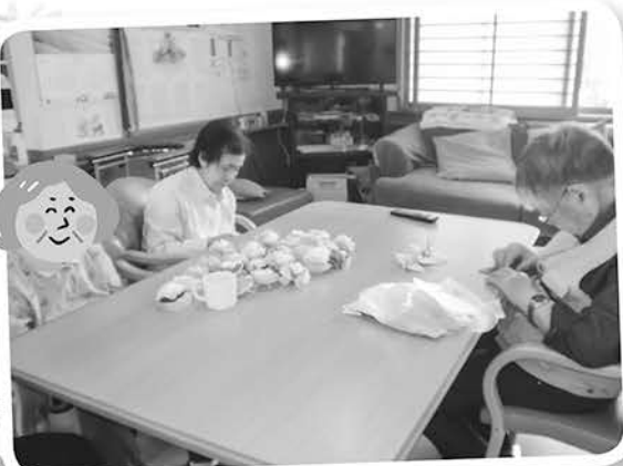
一枚、一枚広げて、鶴も折って。

マイホームでは、7月初めから七夕飾り作りを行い、短冊には、それぞれ願い事を書きました。8月には、行事委員会による踊りの披露があり、笑顔で楽しまれています。