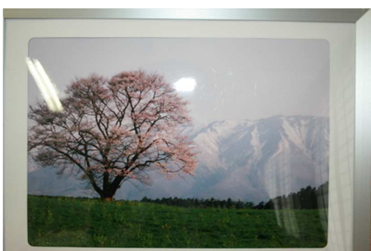
ベストショットの一枚！☆