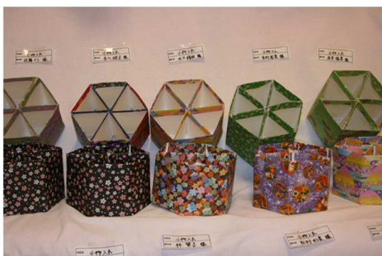
こちらは小物入れのようですね！