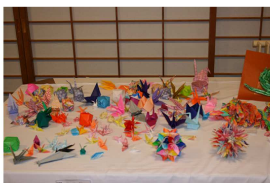
折り紙で器用に作っています！