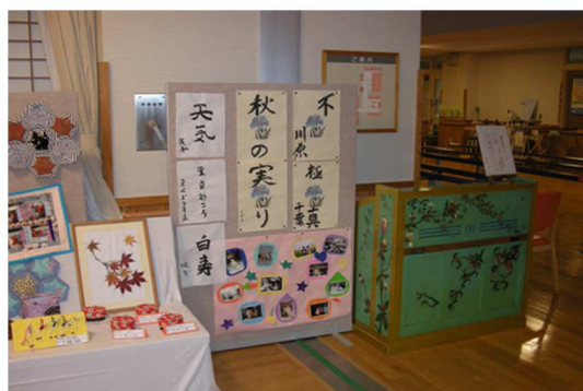
いろいろな物を飾っています！