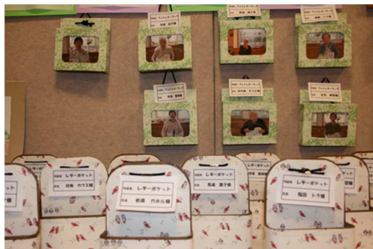
利用者様の作品です！

アットホームくずまきでは11月から12月までの間デイケアの利用者様、入所の利用者様、また先生方が創作された作品や写真、絵を展示しました (*^_^*)