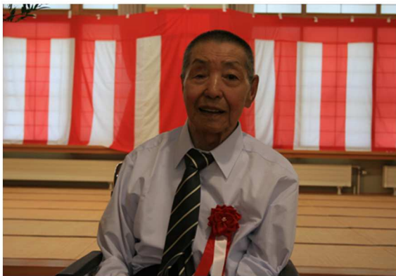
スーツ姿が決まってカッコイイ～！