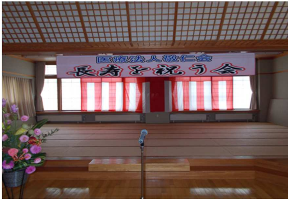
長寿を祝う会の準備中です！

9月7日(日)にアットホームにて、長寿を祝う会が行われました。アットホーム、マイホームからは、古希1名、喜寿4名、傘寿1名、米寿6名、卒寿8名、計20名の方がお祝いされました！余興では、ハナミズキの会による踊りを楽しまれました(^_^)/