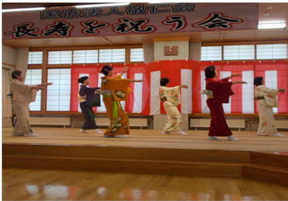
ハナミズキの会による余興！踊りを披露していただきました♪