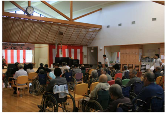
利用者様、家族様、沢山の方々に参加して頂きました♪