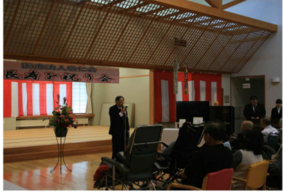
理事長からのあいさつ！