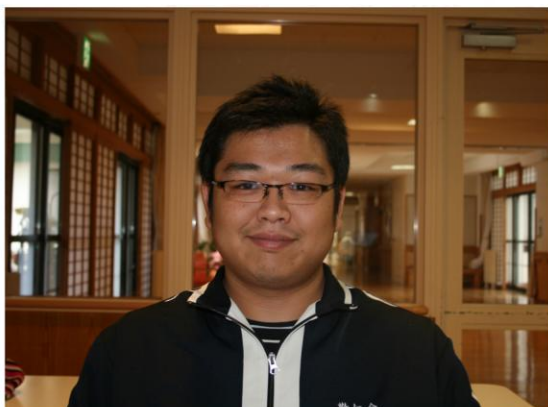
たか はし のぶ ゆき 高橋伸之