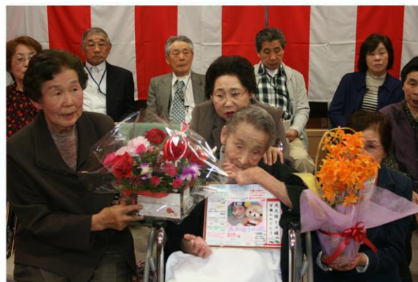
きれいな花束と棟スタッフのお祝いメッセージ色紙もプレゼントされました！