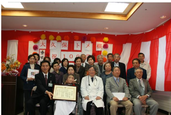
最後は皆さん集まって写真撮影です(*^_^*)