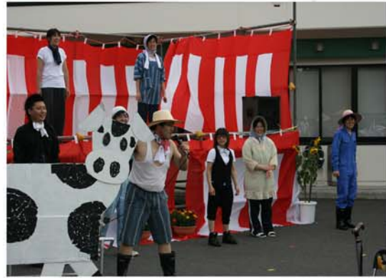
牛の花子!?!も踊りを見にやってきました