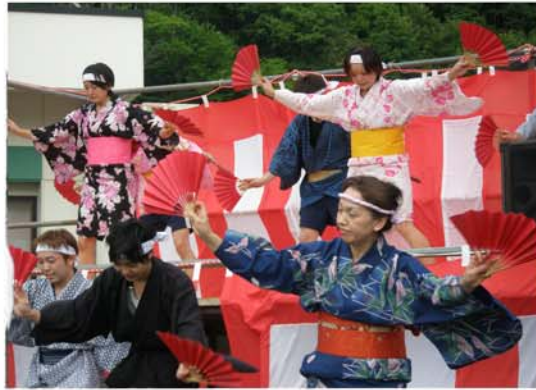
恒例の『すずめ踊り』で華やかにオープニングです