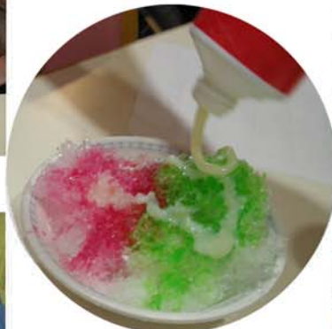
練乳もたっぷりね♡