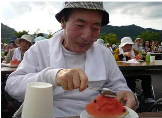
暑い夏は、スイカが最高~!!