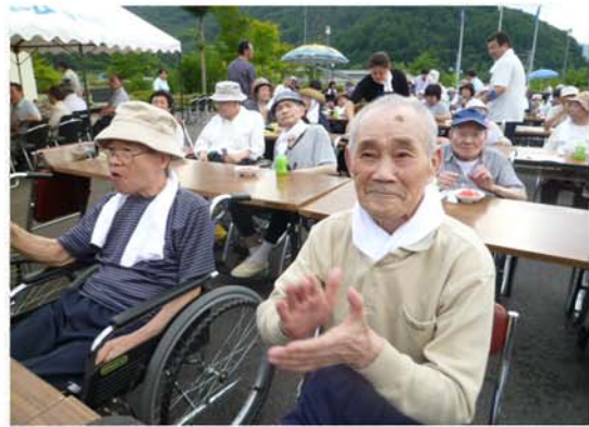
楽しい踊りに、手拍子で参加です