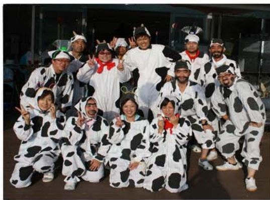
デイケアは利用者様に踊りを教えていただきました

本番直前に通り雨が降り、気温も少し下がりましたが、今年は例年のない猛暑が続き、利用者様の体調が心配されましたが、スイカを食べたりお茶など水分も十分にとりながら、楽しい踊りや催し物も満喫されていました