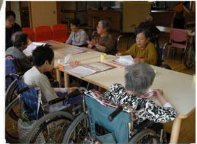
涼んだ後は大好きなカラオケで楽しめます。