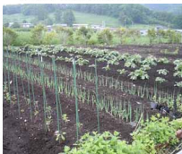
様々な種類の野菜が期待できそうです。