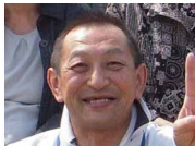
なし こした やす し 梨子 下 靖 志