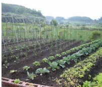
畑も着々と準備が進んでいます。