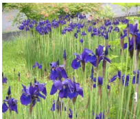
施設周辺のあやめが満開です。散歩が楽しみです。