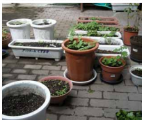
中庭のプランターには何が植えられたのでしょうか？