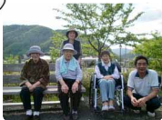
みんな笑顔で “ハイチーズ”