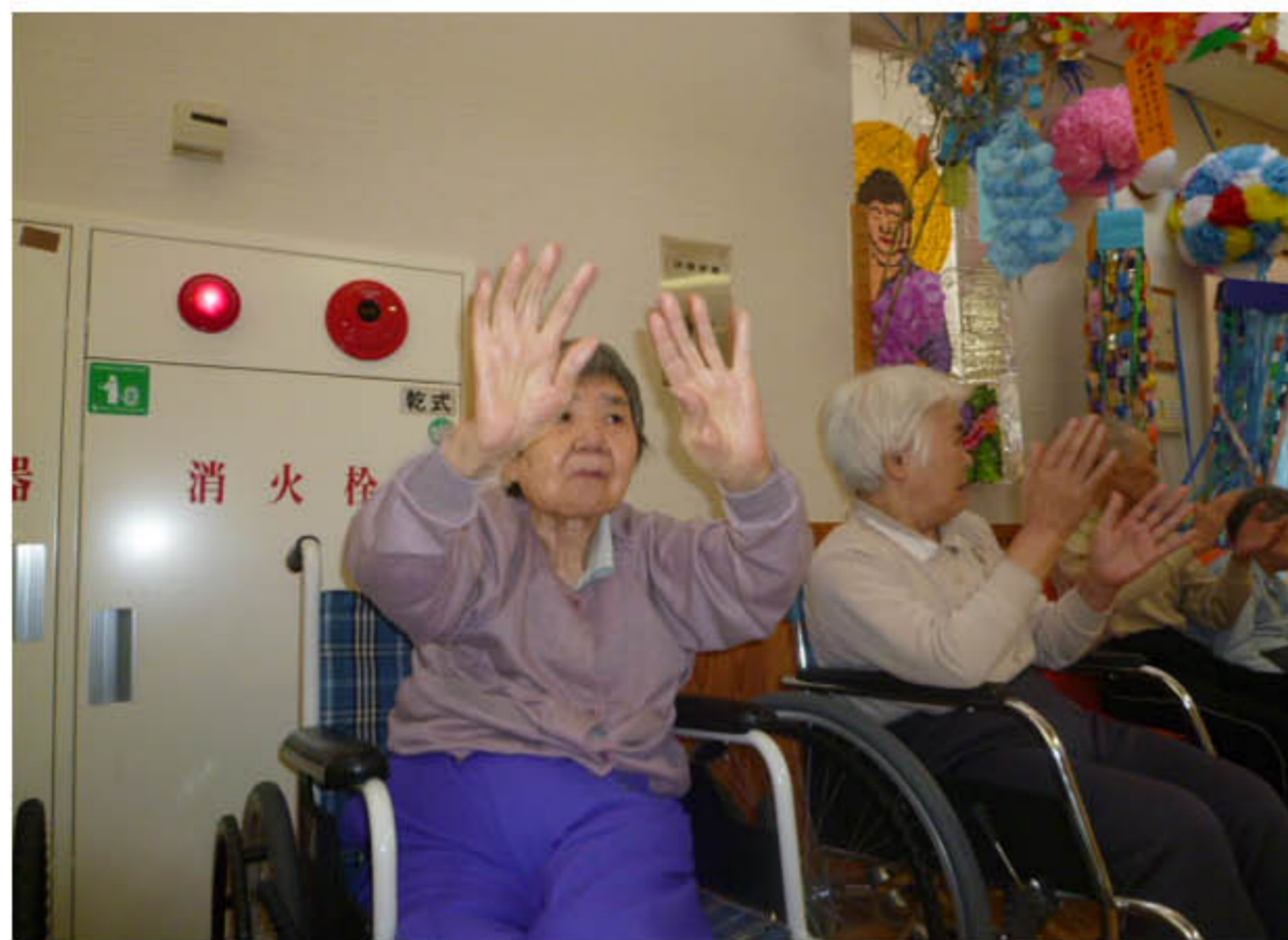
一生懸命踊ってます