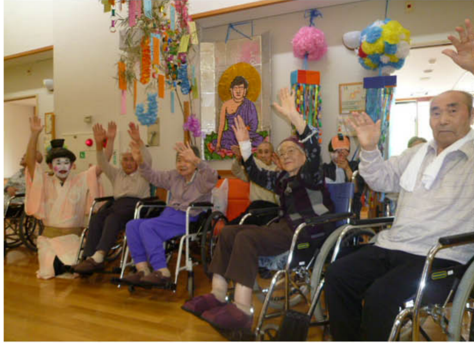
みんな揃って「万歳!!」