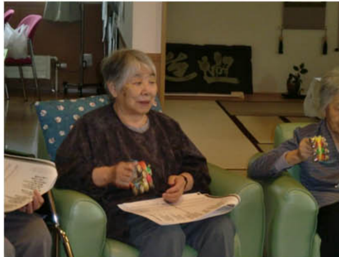
「上を向いて歩こう」♪