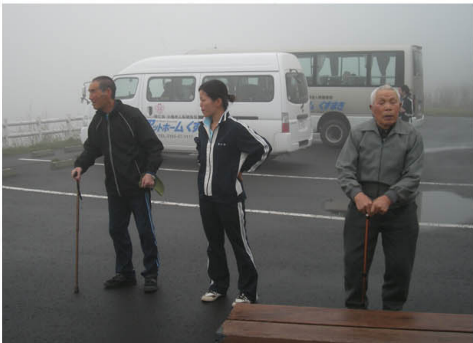
ありゃっ！今日は霧かぁ～