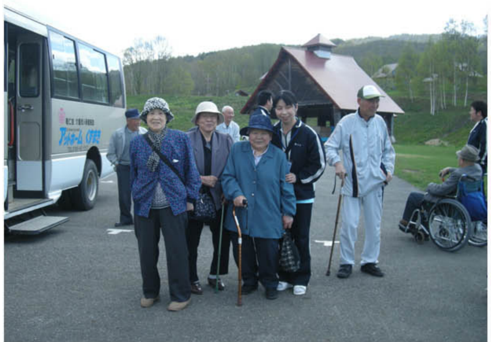
みなさんで記念に1枚😊