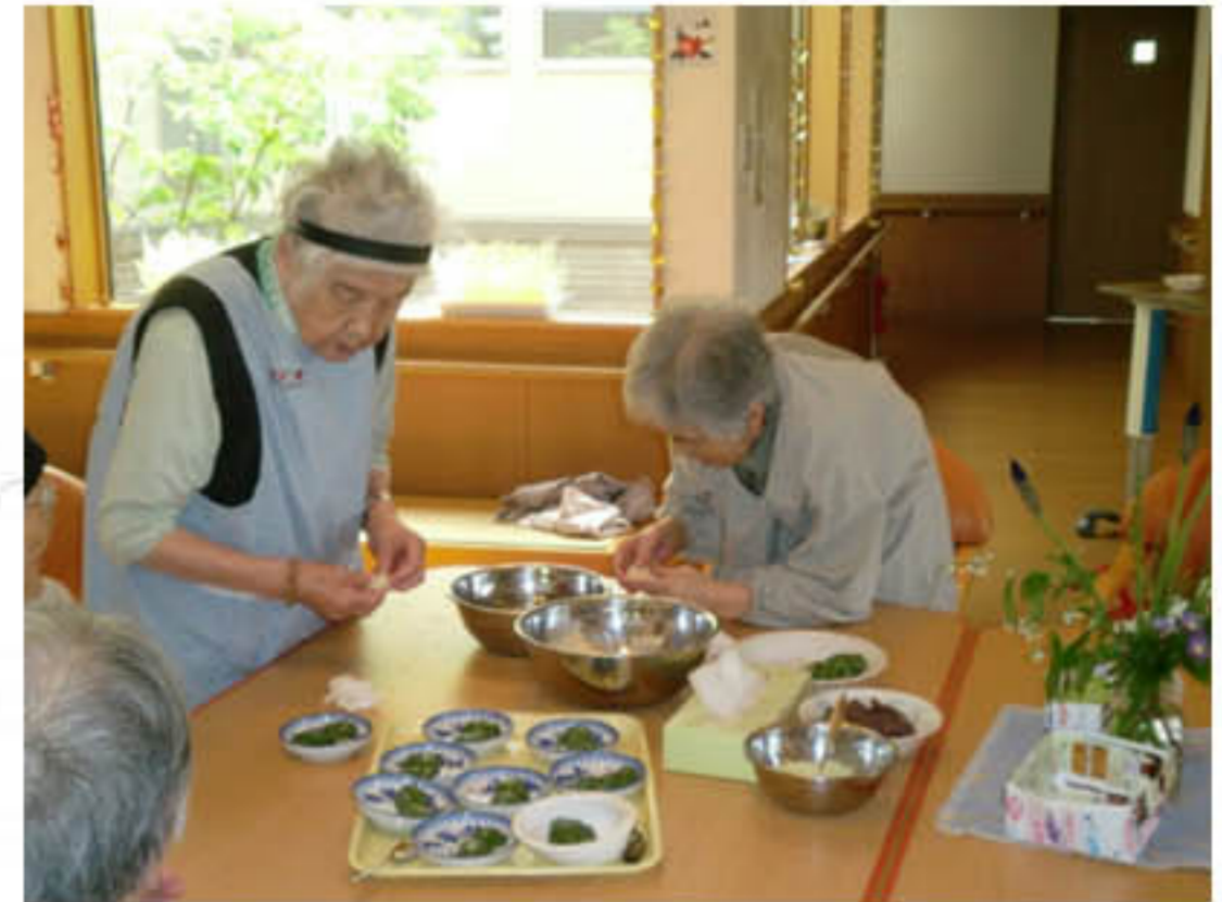
よもぎだんご作り