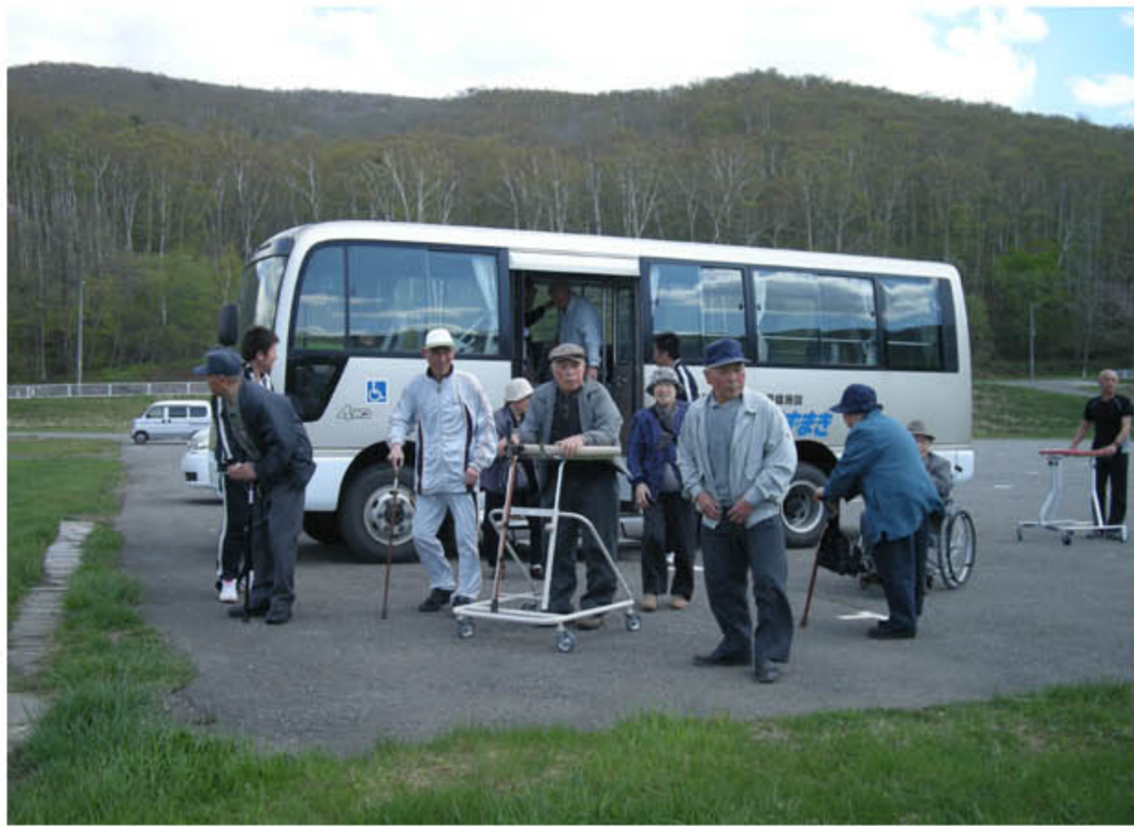
さあ、到着！どれどれ

デイケアくずまきは、5月16日(月)～5月21日(土)の6日間、バスハイクとして前半の3日間は平庭方面へ、後半の3日間は袖山方面へ行ってきました。 お天気にめぐまれた日も、そうでなかった日も、高原のさわやかな空気を楽しんできました。