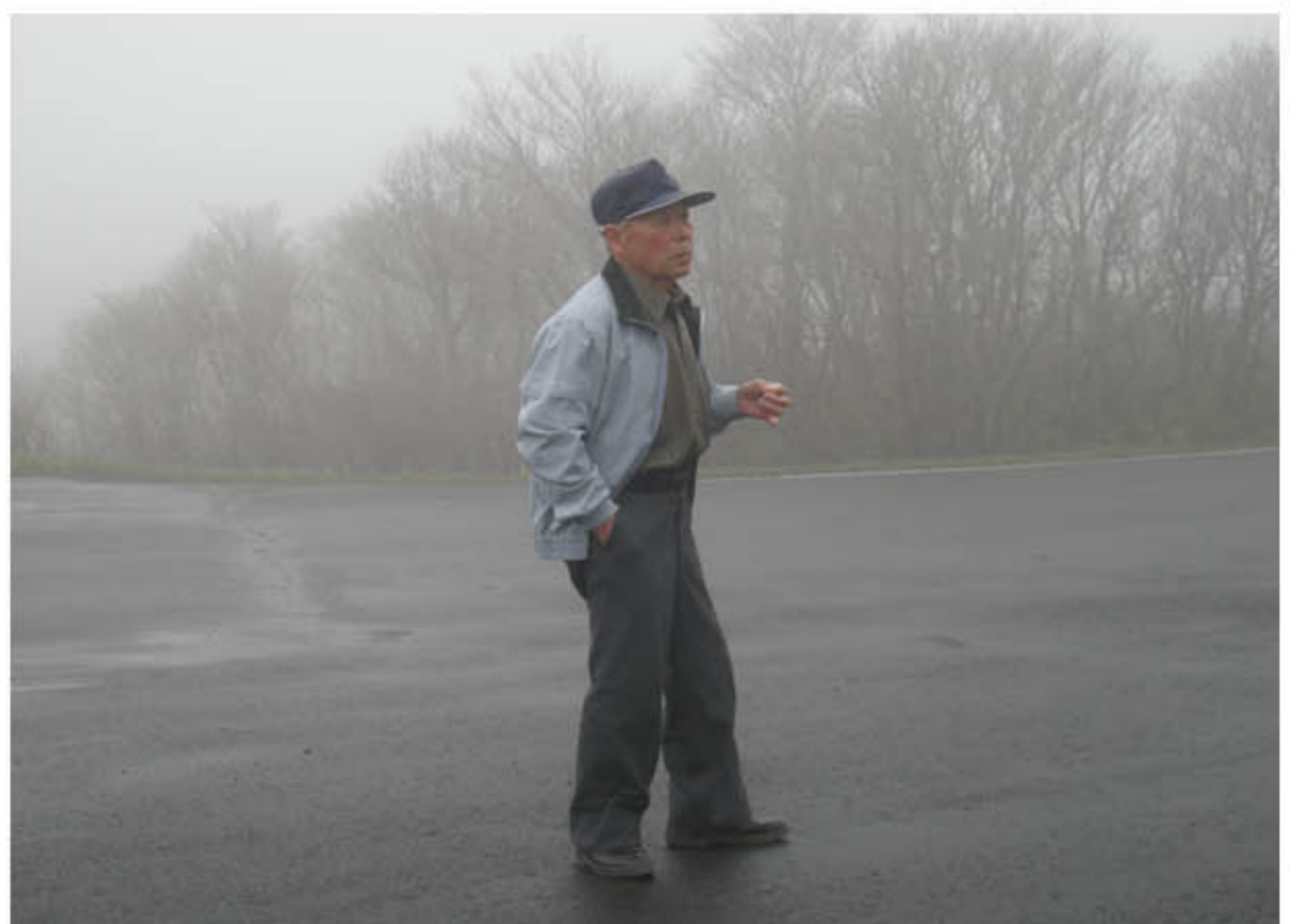
こんな霧もめずらしい。見事だ！