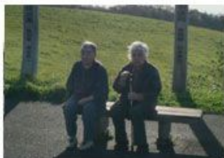
ホントにいい天気!