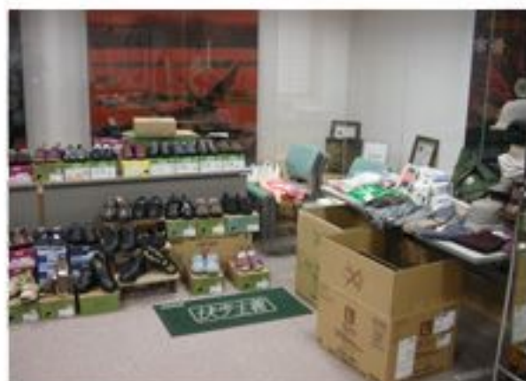
色々揃っていますよ

また、同時にハンドマッサージとお化粧品ケアも実施し、多くの利用者様に喜んで頂きました。