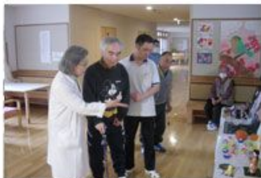
色々な作品が展示されています

食欲の秋、運動の秋、そして芸術の秋ということで、今年もアットホームくずまきの文化祭が行われました。11月14日～27日の間、ご利用者様、職員などの芸術作品が多数展示されました。