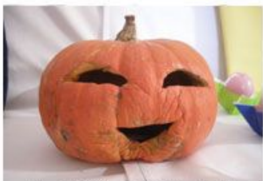
にっこり笑っているようです