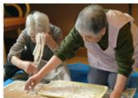
美味しそうなはっとの出来上がり