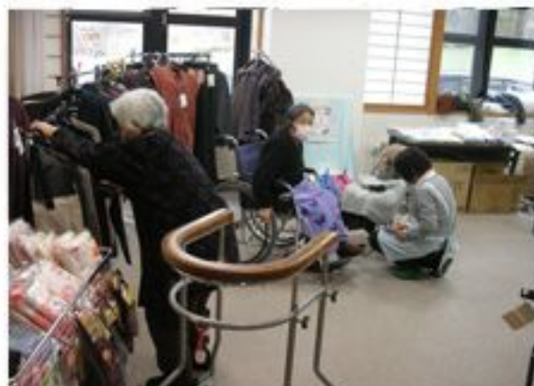
お気に入りは見つかった？