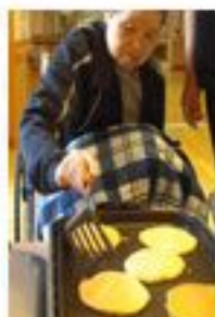
ホットプレートで焼いて