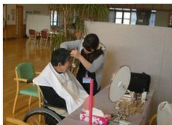
男性用のお化粧品もありますよ