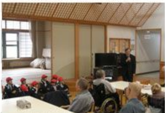
ご利用者様は大喜びです

11月19日、葛巻小学校の1年生がアットホームくずまきに来所され、踊りの披露や手作りのプレゼントをいただきました。ご利用者の皆様はとても喜んでいました。たくさんの元気をありがとうございました。