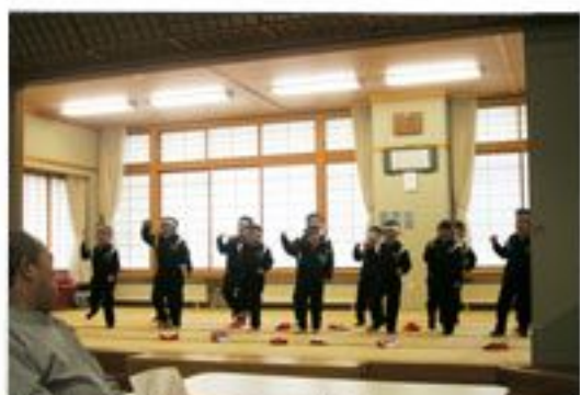
元気いっぱいの踊りを披露してくれました