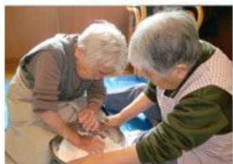
一生懸命にこねて…

11月1日、マイホームくずまきでは『ひぼがはっと』を作って食べました。 昔話をしながらのはっと作りはとても楽しかったです。