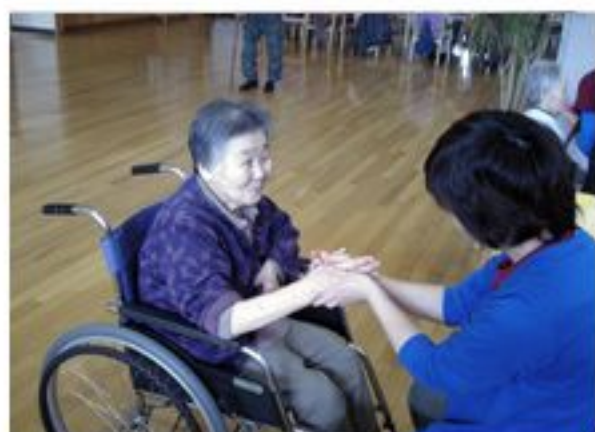
ありがとう！またお願い！