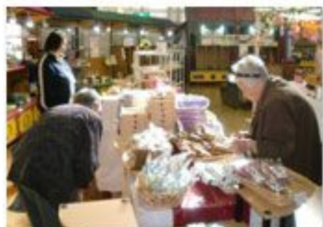
いいのがいっぱい迷うなぁ

10月19日、マイホームくずまきでは袖山、こだま館へバスハイクに出発！ ご利用者様も出発前からすごく楽しみにしており、お天気も良く、楽しい バスハイクになりました。