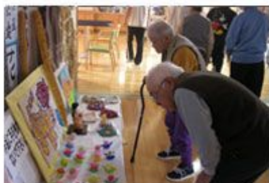
これはどうやって作るんだ？